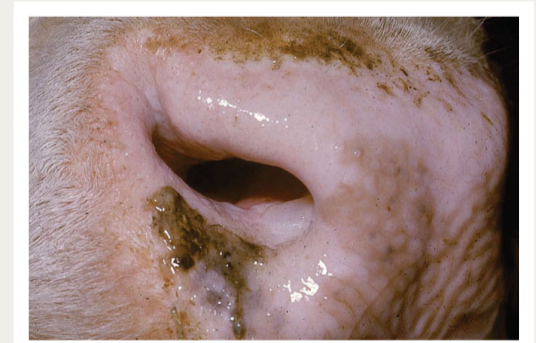
Bees se neus met 'n waterige blase binne die neusgat.