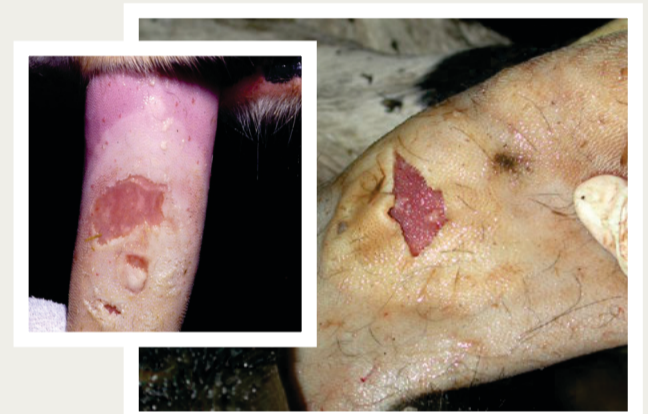
Blasies op tong met geel-ligbruin randte.