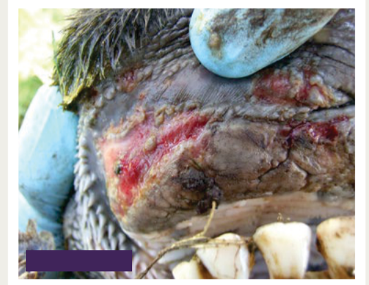
Mondseer waar 'n blase gebars het.