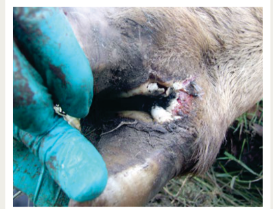
Letsel in the hoewe van 'n koei.